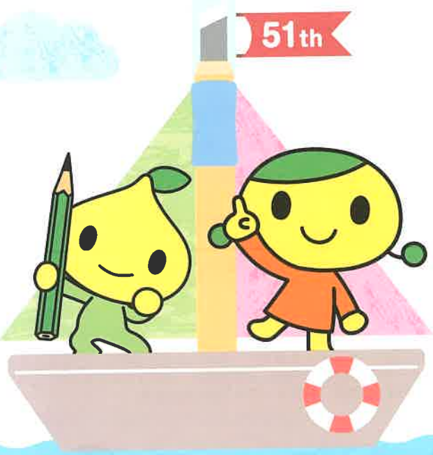
公式キャラクター ピットくん・ピットネ